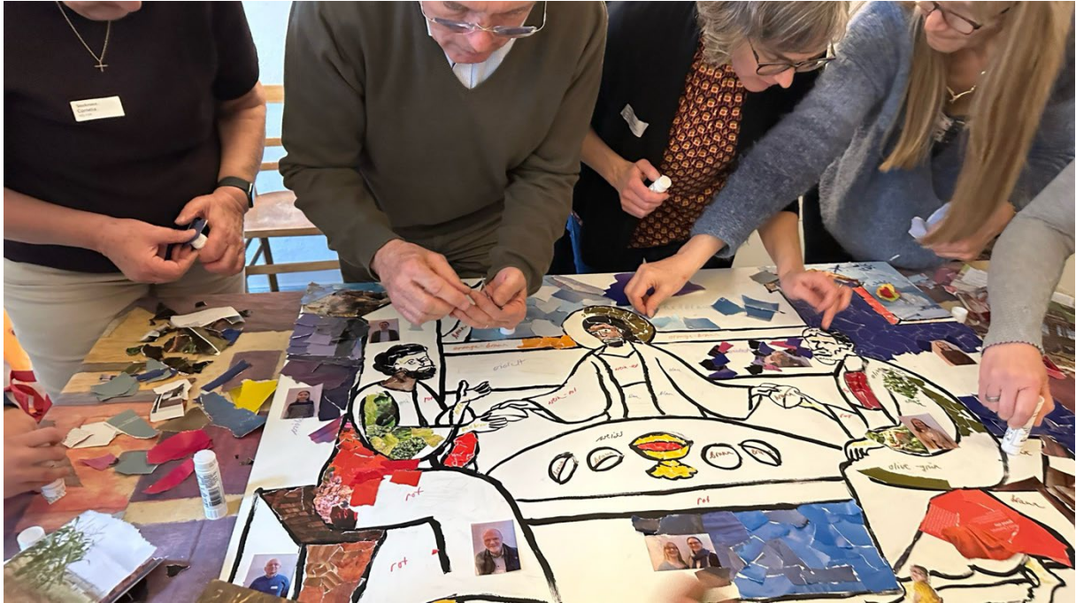
Das Emmaus-Mahl gemeinsam ausgemalt