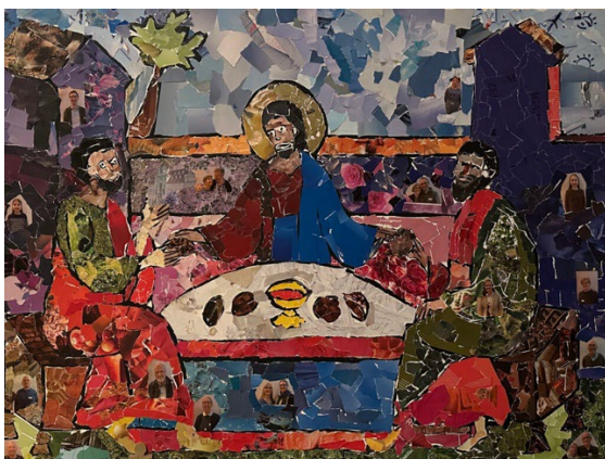
Das Emmaus-Mahl: fertige Collage

Ein weiterer Höhepunkt war die Erzählung von Emmaus (Lukas 24,13-35). Die Gegenwart Christi an der Seite der beiden wandernden Jünger und das gemeinsame Mahl mit dem Herrn ermöglichten es ihnen, aus dem Chaos, der Krise und der Verzweiflung herauszukommen. So